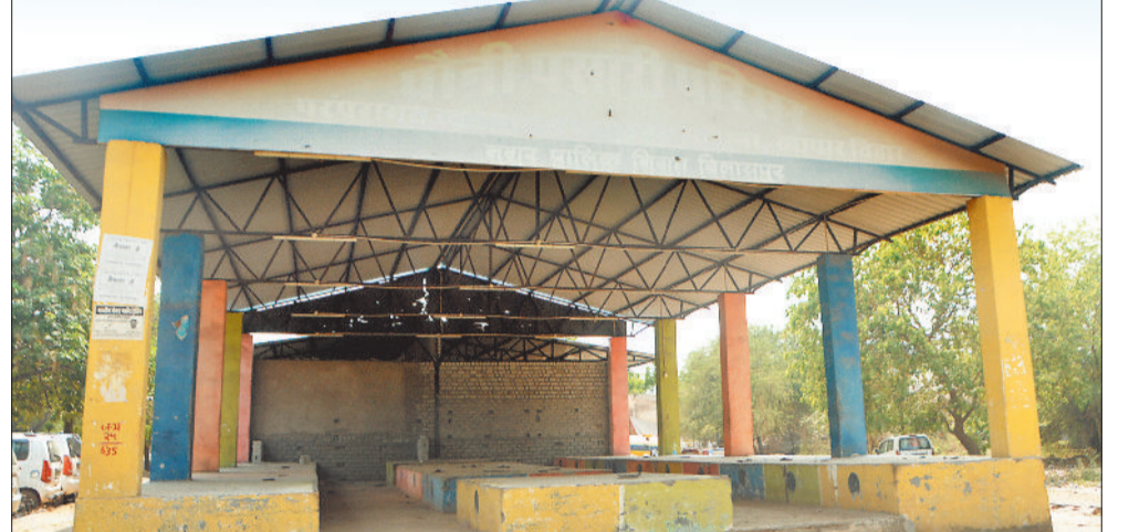
व्यापार विहार में सक्ती बेचने के लिए बनाया गया पौनी पसारी केंद्र।

शहर में पांच जगहों पर वेंडिंग जोन बनाए जाने के साथ ही 4 जगहों पर नानवेज मार्केट भी बनाया जाना था। इसके लिए साढ़े तीन करोड़ रुपए की राशि जिला खनिज न्यास से मांगी गई थी। इसकी स्वीकृति लौकिक नहीं मिल सकी और योजना बंद कर दी गई है। अब निगम किसी दूसरे मद से राशि स्वीकृत कराने की बात कह रहा है। निगम के ही काम चिन्हांकन कर लिया गया, जल्द मुताबिक जगहों का शुरू होगा चिन्हांकन कर लिया गया है और जल्द ही काम शुरू होगा। निगम ने तय किया है कि वेंडिंग जोन व्यापार विहार में, लिंगियाडीह में अपोलो हास्पिटल के पास मानस लाज के बगल में, उमसालपुर में पौनी पसारी योजना के बगल में, चंद्रिका होटल के पीछे और चांटीडीह सक्ती बाजार के पास बनाया जाएगा। इसके साथ ही नानवेज मार्केट मोपका, सकरी, शनिचरी और व्यापार विहार में बनाए जाएंगे।