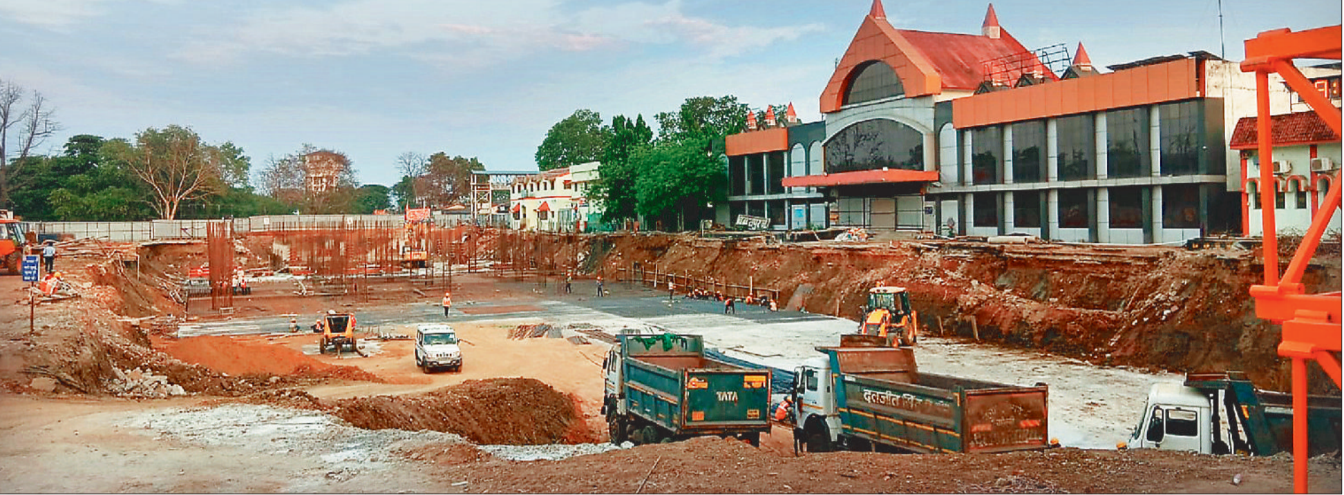
जोनल रेलवे स्टेशन में 392 करोड़ की लागत से विकास कार्य कराए जा रहे हैं, इसके लिए गेट नंबर 3 के सामने भारी भरकम गड़्हा खोद दिया गया है, यहां धीमी गति से काम चलने के कारण यात्री हलाकान हो रहे हैं।