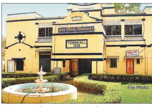
नगर निगम के आनलाइन पोर्टल के जरिए घर बैठे अपना टैक्स जमा किए हैं। आनलाइन टैक्स जमा करने की सुविधा से नगर निगम के राजस्व में वृद्धि हुई है। इसके अलावा निगम कार्यालयों में काउंटर के जरिए टैक्स जमा कराया गया, वहीं निगम का राजस्व अमला घर-घर घूमकर डोर-टू-डोर टैक्स वसूली भी की है।

केवल 35 प्रतिशत जलकर की वसूली नगर निगम जल कर वसूली में पीछे रहा है। निगम को लगभग 10 करोड़ 50 लाख राशि जल कर का वसूली करना था। इसमें 4 करोड़ राशि के आसपास ही वसूली हो पाई है जो कि 35 प्रतिशत वसूली के करीब है। जल कर आनलाइन नहीं होने का भी नुकसान निगम को हुआ है। निगम प्रापटी टैक्स, समेकित कर, यूजर चार्ज जैसे टैक्स जमा करने के लिए आनलाइन सुविधा